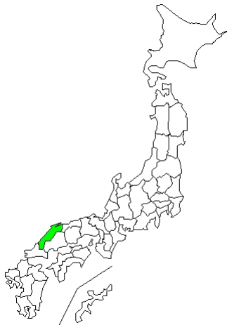
3 例 Coxsackievirus B5