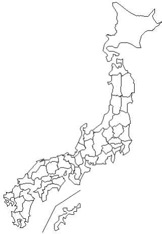
報告なし Enterovirus 68 合計